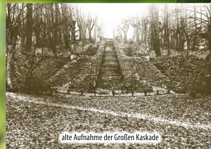
alte Aufnahme der Großen Kaskade