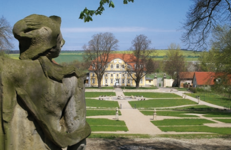
Nördliches Parterre – Blick zum Karl Marien Haus (ehem. Orangerie)

Die Gartenanlage am ehemaligen Schloss Ebeleben zählt zu den bedeutendsten Barockgärten in Thüringen und stellt in Deutschland in vieler Hinsicht eine Besonderheit dar. Sie entstand im 17. und 18. Jahrhundert durch das Fürstenhaus Schwarzburg-Sondershausen. Entgegen dem Idealschema einer barocken Parkanlage ist hier die Hauptachse nicht zum Schloss gerichtet sondern die Schlossanlage ist über eine fast rechtwinklig verlaufende Nebenachse mit ihr verbunden. Der Garten hat eine Längenausdehnung von über 300 m und überwindet dabei 18 m Höhenunterschied.