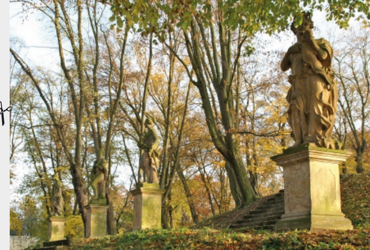
Blick auf alle 4 Göttinnen (Allegorien der Jahreszeiten und Elemente)

Spenden können Sie auf folgendes Konto der Kyffhäusersparkasse überweisen: BIC: HELADEF1KYF, IBAN: DE97 8205 5000 3000 0048 22