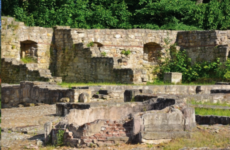
Blick auf die Reste des sogenannten ehemaligen Ebeleber Hauses

Die Fortführung der Sanierung der Einfriedungsmauern und der Stützmauern des Wassergrabens sowie die Rekonstruktion der steinernen Bogenbrücke an den bereits sanierten Kavaliershäusern und eines ehemaligen Turmes sind weitere notwendige Bauarbeiten für die Zukunft.